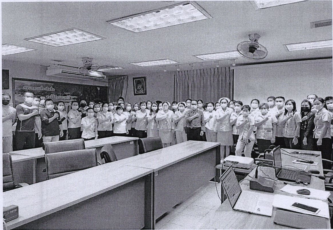
กิจกรรมประกาศเจตจำนงสุจริตของผู้บริหารสูงสุดของหน่วยงานต่อสาธารณชน